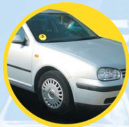
Vor Nachrüstung Gelbe Plakette