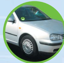
Nach Nachrüstung Grüne Plakette