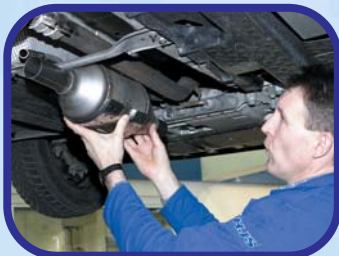
Nachrüstung Einbau City-Filter® ca. 45 Minuten